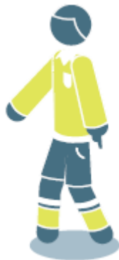
Удар от ворот