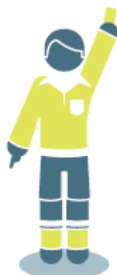
Красная и желтая карточка